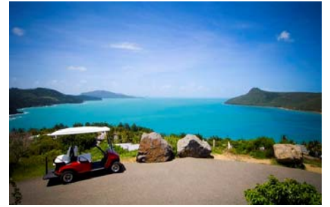
日本語バギー観光に参加