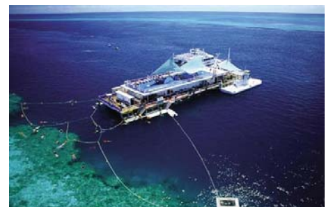
ファンタシー・リーフワールド