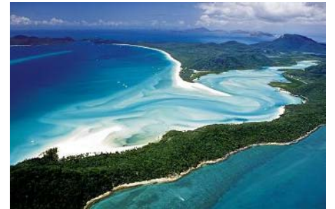
ホワイトヘブンビーチ&ヒルインレット