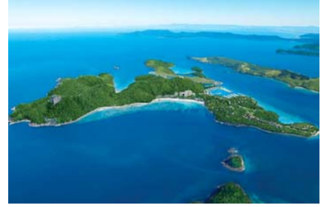
間もなくハミルトン島到着